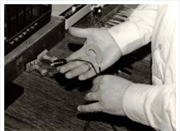
DDR-Neuheit! Ansicht einer HdO-Induktionsplatte aus unserer Fertigung

Als alle Vorbereitungen abgeschlossen waren, stellte uns dieser Werkzeugmacher-Kollege noch drei Gussformen aus Edelstahl mit je acht Kammern für die Serienfertigung her. Damit war es uns dann möglich, rationell je vierundzwanzig unserer HdO-Induktionsplatte, einschließlich Inhalt und Anschlussleitung gleichzeitig zu gießen.