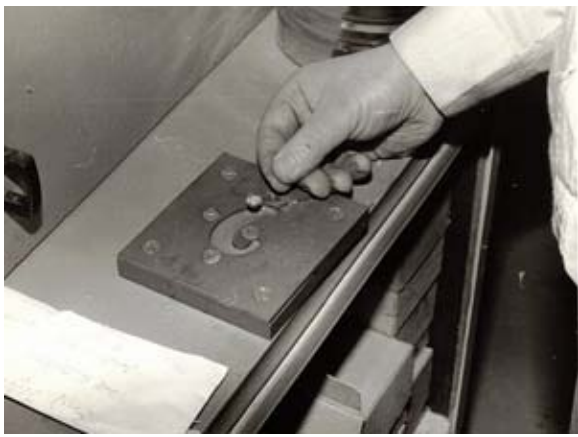
Probegussform für unsere HdO-Induktionsplatten mit Induktionsspule

erforderte eine Reihe sogfältiger Versuche. Eine spezielle Art von Spule war für die Serienfertigung der Induktions-Platte notwendig. Diese flache Spule musste einen Durchmesser von 9,0 mm und eine Dicke von 2,0 mm haben und dazu ohne Kern und Gehäuse gefertigt werden. Die Aderstärke des Spulenmaterials war für den notwendigen Anschlusswert, von 6,0 Ohm zu berechnen. Genau nach meinen