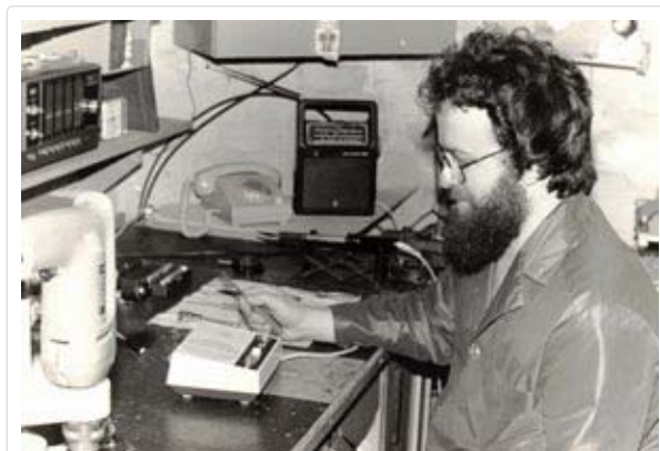
Erster Arbeitsplatz - so ging es los

In Dankbarkeit, Zuversicht und voller Optimismus ging ich an mein Werk! Natürlich war mir von Anfang an klar, dass ich das Ganze praktisch nicht allein schaffen kann und weitere neue Erzeugnisse im Zusammenhang mit dem induktiven Hören hatte ich für die Zukunft auch schon längst im Kopf.