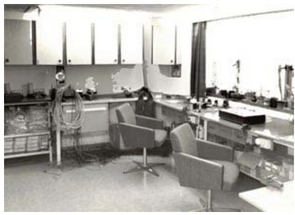
Arbeitsraum nach Umbau - Teilansicht

Sowjetischen Kommandantur in Wittenberg zur Hilfe. Auch das klappte problemlos und den Beiden ging es bei uns so richtig, richtig gut!