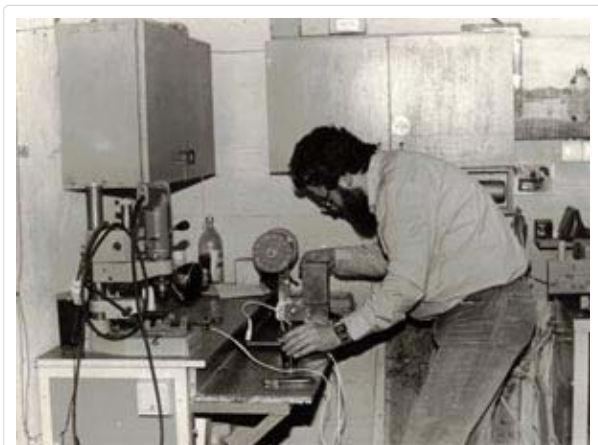
Erste Ausstattung im Arbeitsraum - Teilansicht

Wenige Zeit später fand auch eine zweite Kollegin für die nächsten Jahre ihre Arbeit bei uns. Die Fertigung unserer Induktionsringschleifen lief problemlos, und wir haben dabei auch alle privaten Bestellungen DDR-weit laufend zuverlässig ausgeliefert.