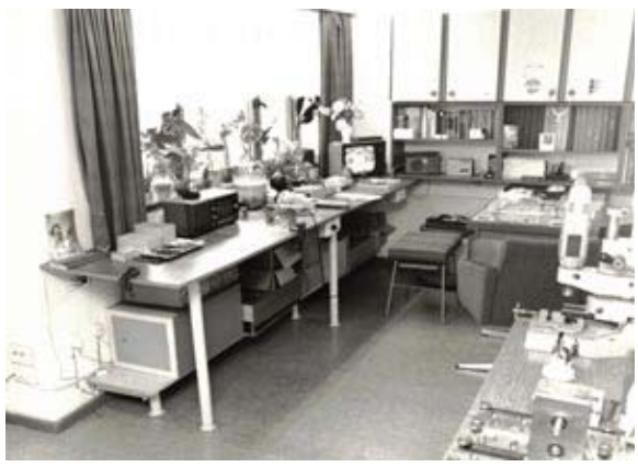
Arbeitsraum nach Umbau - Teilansicht