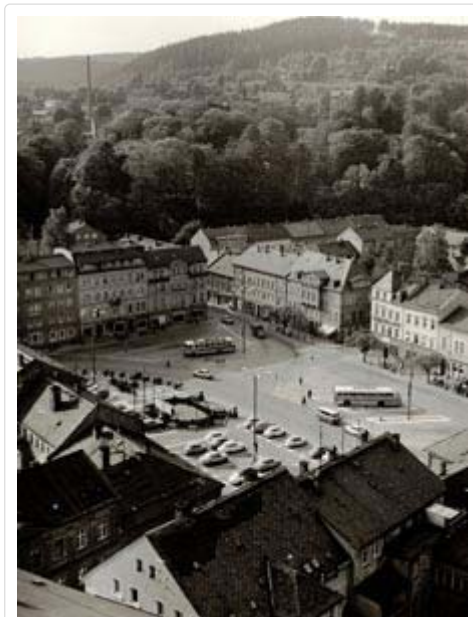
Sebnitzer Marktplatz um 1970

Unten im Stadtzentrum bummelte ich über den Markt und durch die anliegenden kleinen Straßen. Im Stadtzentrum waren überwiegend stattliche, mehrstöckige Wohnhäuser, teilweise mit kleinen und größeren Betrieben und gleichzeitig ein Geschäft neben dem anderen. Was mir an diesem Wochentag ganz besonders auffiel und Erinnerung blieb, war das quirlige und aktive Leben der Sebnitzer Bevölkerung. Alle hatten ganz beschäftigt etwas zu tun. Unbewusst, aber für ein ganzes Leben, verliebte ich mich an diesem Tag in dieses kleine aber ganz besondere sächsische Städtchen.