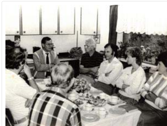
Arbeitsbesprechung mit dem Bezirksvorstand Halle des Schwerhörigenverbandes in unserem Arbeitsraum

Von Anfang an versuchte ich auch, mich in der gesellschaftlichen Arbeit beim Zentralvorstand des Gehörlosen- und Schwerhörigen Verbandes der DDR in Berlin mit einzubringen. Gern übernahm ich auch vor meiner beruflichen Selbstständigkeit die „Hörmittelberatung“ bei den Bezirksvorständen in Halle und Dresden und war dort auch oft bei den Beratungen anwesend.