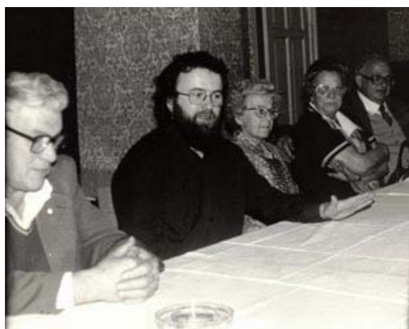
Versammlung der Gruppen-Mitglieder des Schwerhörigenverbandes in Wittenberg

Im Rahmen meiner Möglichkeiten habe ich nun in der Freizeit an allen möglichen Dingen meiner hörbehinderten Mitmenschen Reparaturen durchgeführt oder auch z. B. nach individuellen Wünschen Kopfhöreranlagen angefertigt.