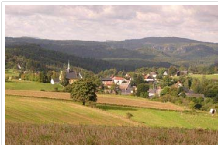
Blick von der Emmabank über Hinterhermsdorf und der herrlichen Felsenwelt

Inzwischen hatte ich mich im wunderschönen sächsischen Felsengebirge gut eingelebt, kam wirklich super mit den Mitmenschen zurecht und hatte auch eine stabile persönliche Situation - ich wollte von dort nicht wieder weg!