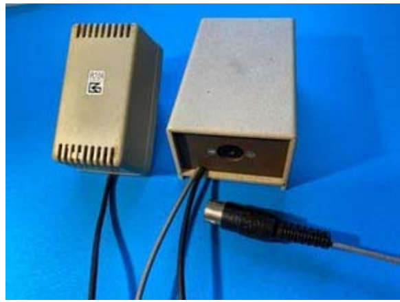
Ein kompletter Hörschleifenverstärker aus unserer Fertigung