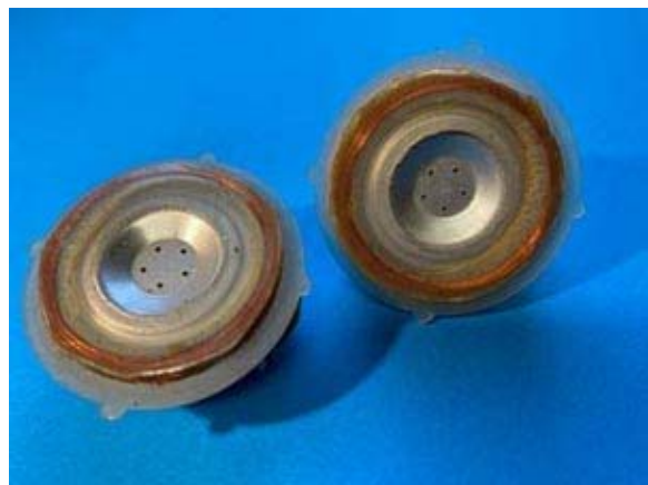
Funktionsmuster unserer Induktiven Hörkapseln. Vorgesehen für die DDR Telefonproduktion im Fernmeldewerk Nordhausen

Die Produktion, das Bearbeiten der einzelnen Bestellungen und das tägliche Versenden unserer Erzeugnisse mit der Post prägten hauptsächlich unsere Arbeitszeit. Donnerstags hatten wir zusätzlich den ganzen Tag eine Sprechzeit für die Öffentlichkeit eingerichtet. Oft kamen auch Menschen einfach so zwischendurch. Auch dann blieb bei uns niemand vor der Tür stehen. Meine spezielle Aufgabe bestand natürlich in der gesamten Zeit auch darin, unsere Erzeugnisse für eine Serienfertigung zu entwickeln. Diese Arbeiten hatten für mich einen besonderen Reiz. Es war immer ein Erfolg und ich war auch etwas stolz darauf, wieder ein neues Erzeugnis für unseren hörgeschädigten Mitmenschen in der Republik geschaffen zu haben!