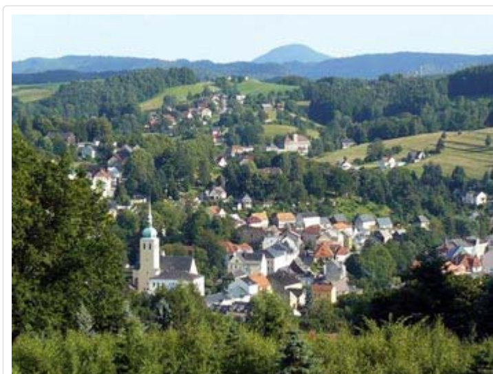
Blick auf Sebnitz

Von Bad Schandau kommend, fuhr ich mit der einst sogenannten „Sächsisch-Böhmischen Semmeringbahn“ knapp 20 km nach Sebnitz. Es ging bis dahin durch das felsige Sebnitztal mit den sieben Tunneln. Kurz vor Sebnitz noch über zwei Viadukte aus Granitgestein, bis die Dampflokomotive den Zug auf dem Bahnhof, oberhalb des Stadtzentrums, zum Stehen brachte. Vom Bahnhof aus hatte ich nun den ersten Blick auf diese liebe Stadt.