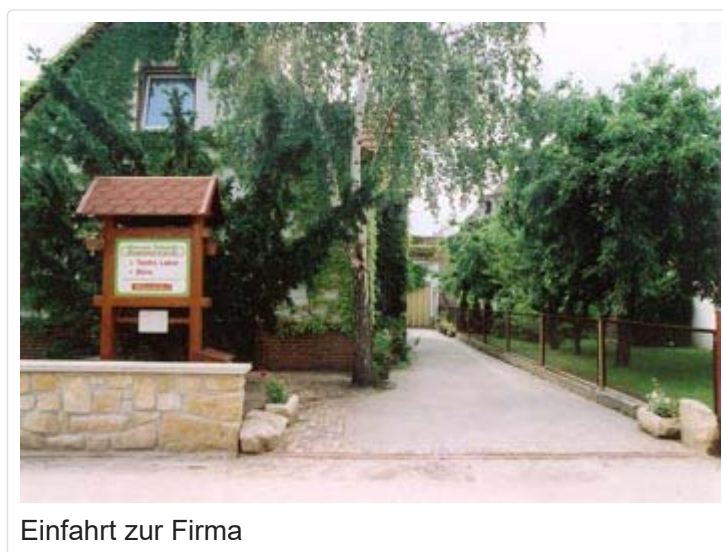
Einfahrt zur Firma

Der Verteilungsschlüssel mit den monatlichen Stückzahlen unserer Induktionsringschleifen wurde uns vom Zentralvorstand in Berlin vorgegeben. Zuverlässig erfüllten wir bis Anfang 1990 immer diese Vorgaben.